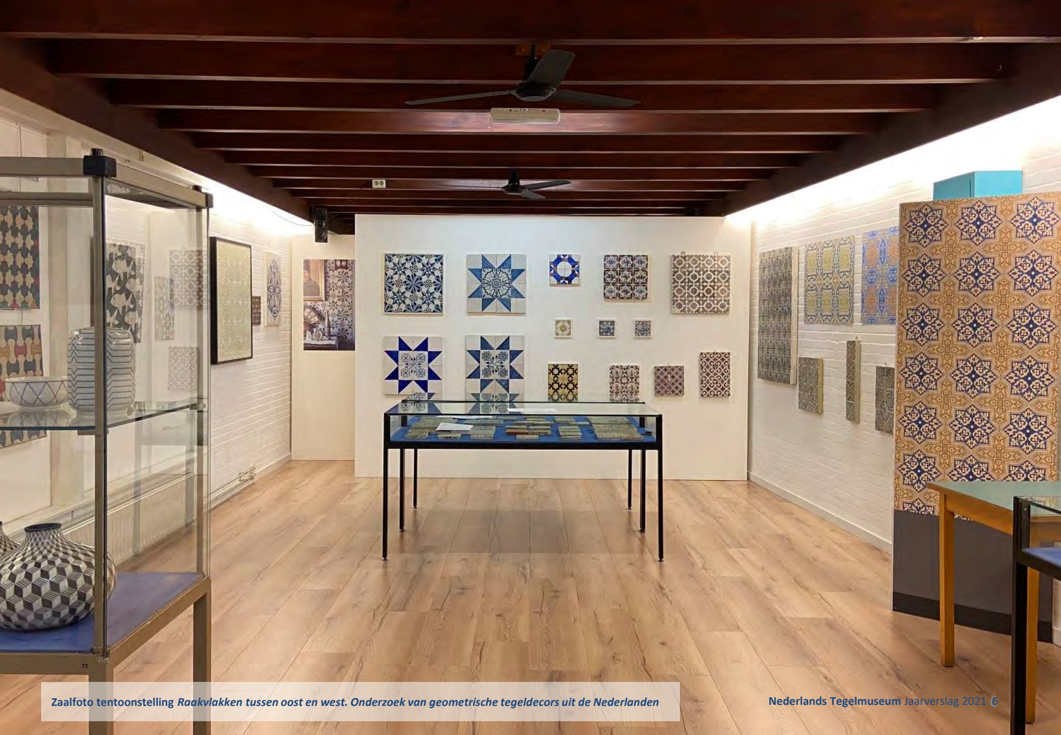
Zaalfoto tentoonstelling Raakvlakken tussen oost en west. Onderzoek van geometrische tegeldecors uit de Nederlanden