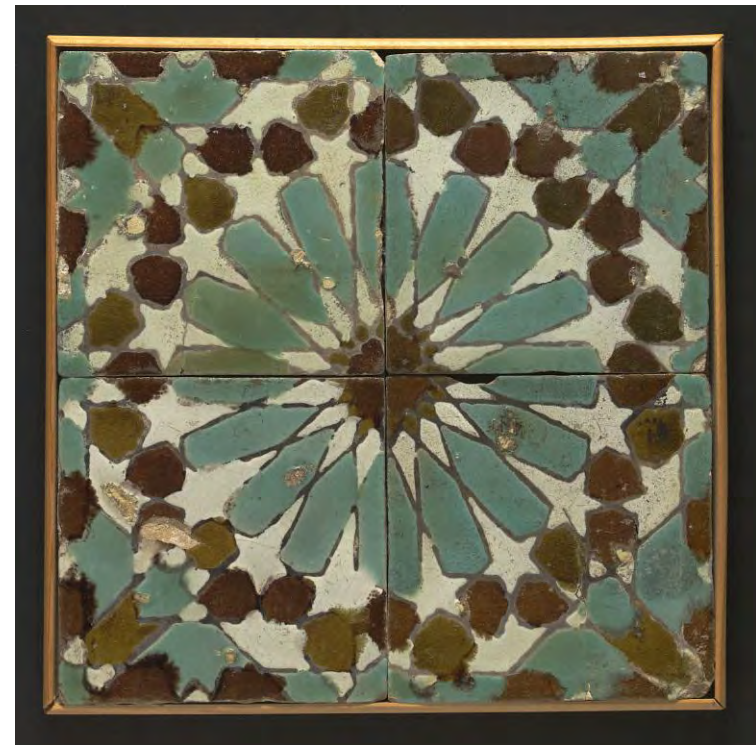
Tegelveld Ornamenteel geometrisch patroon, 1500_1600, Spanje. Te zien in de tentoonstelling Raakvlakken tussen oost en west .

Gouda was heel lang een stad met veel aardewerkfabrieken, waar ook veel tegels werden gemaakt. Zeker vóór de Tweede Wereldoorlog zijn daar hele mooie tegels gemaakt bij met name Zenith, Goedewaagen, Ivora en Iris. Vooral tegels met topografische afbeeldingen spreken tot de verbeelding.