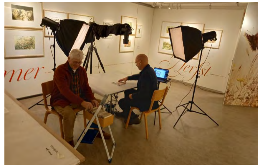
Collectiefotografie in het Nederlands Tegelmuseum