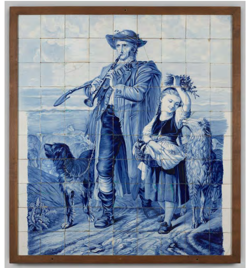
Tegeltableau met herder en meisje, Jacobus ten Zweege, Makkum 1881

Net als in eerdere jaren ontving het museum uit de STANYA-collectie een aantal tegels en platen van de Haagse Plaatelbakkerij Rozenburg, deze keer vijf objecten. Zie pagina 21 voor een tegelplaat uit deze gift.