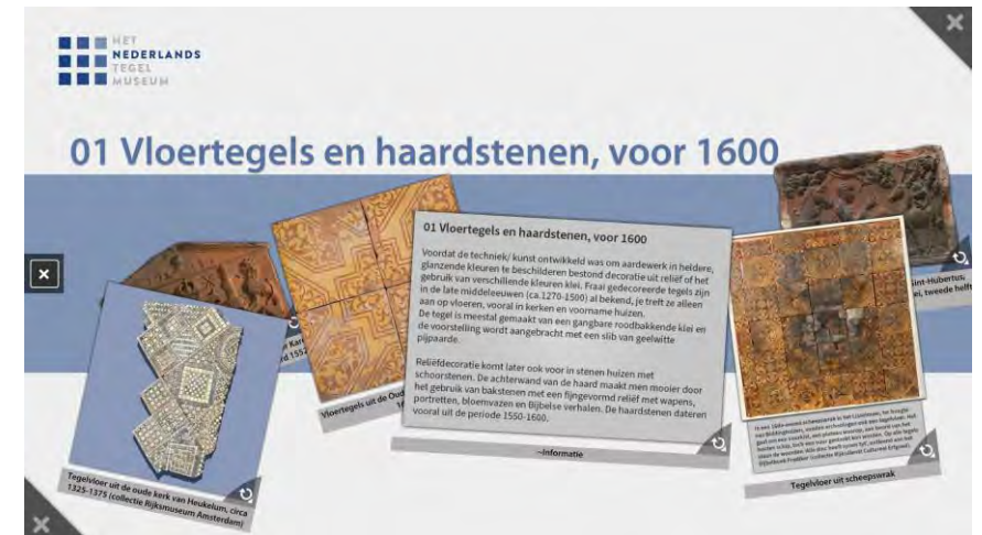
Een still uit de tijdljn