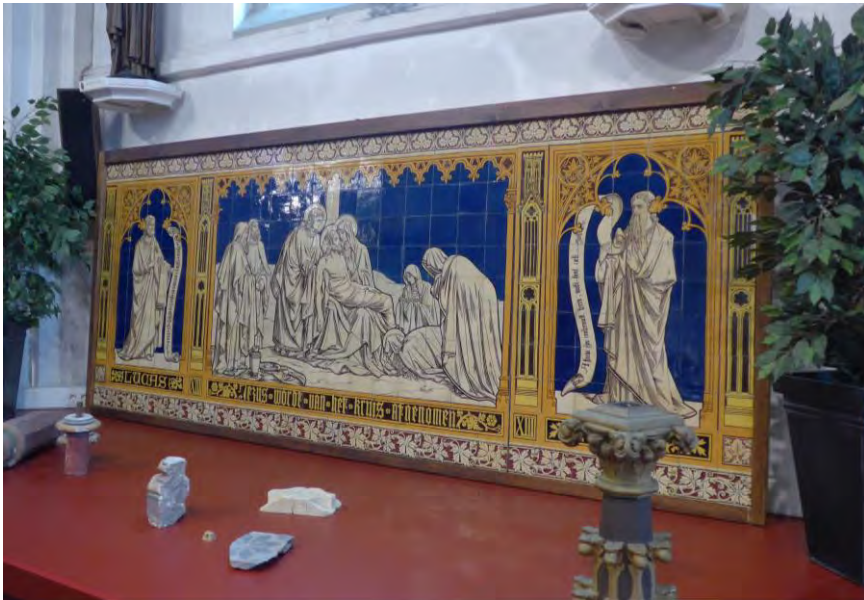
Bruikleen van het Tegelmuseum te zien in het Heiligenbeeldenmuseum Kranenburg-Vorden