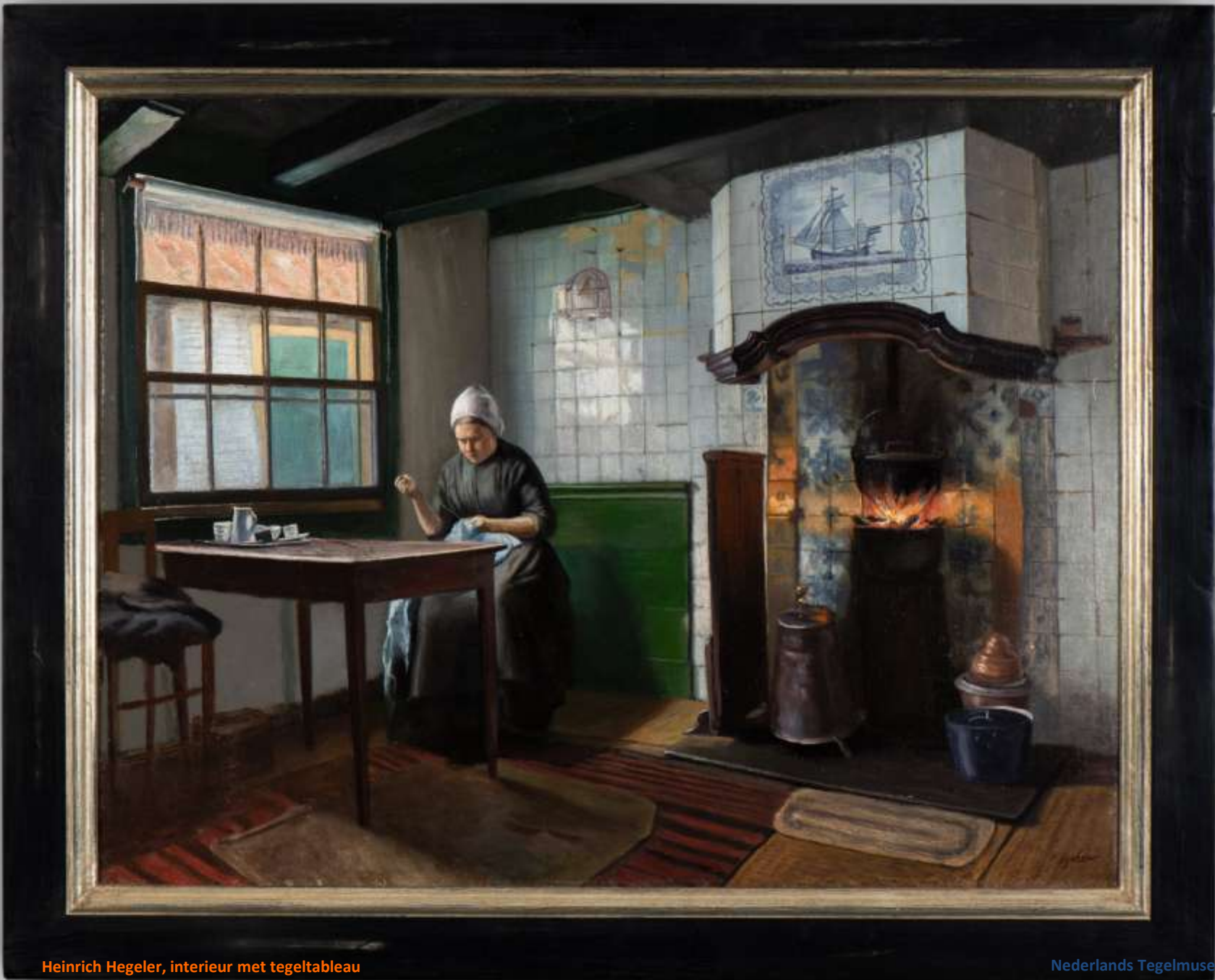
Heinrich Hegeler, interieur met tegeltaleau