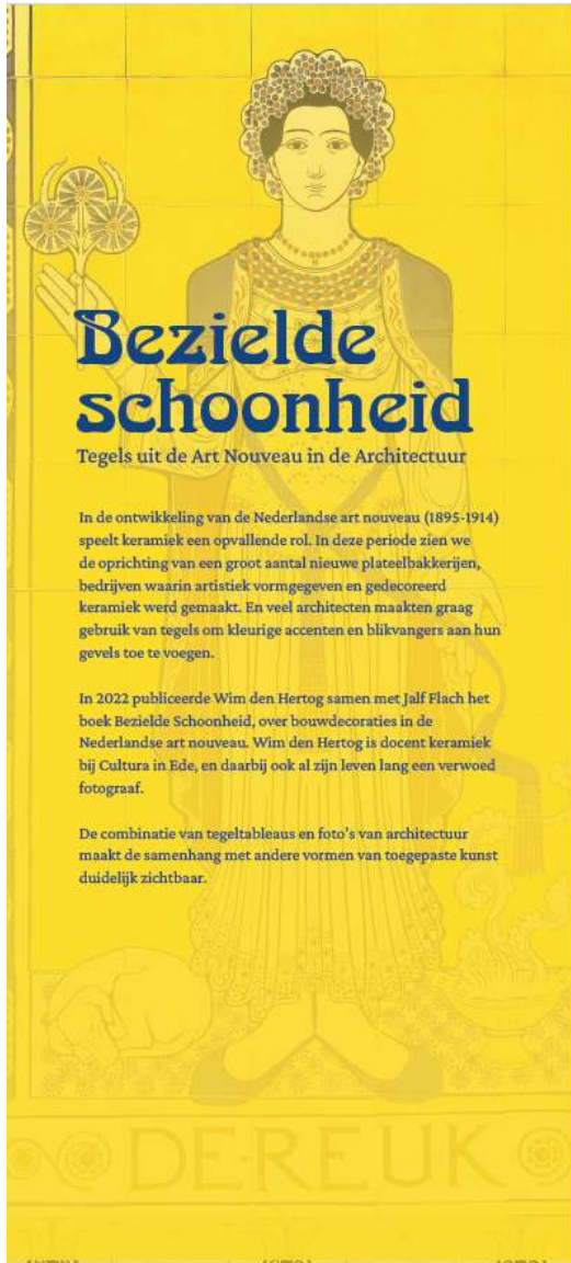
De introductiebanner van de tentoonstelling Bezielde Schoonheid