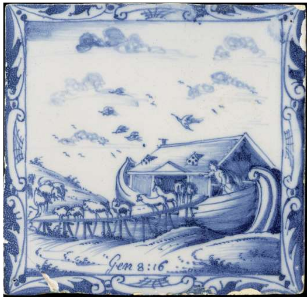
Links: de ark van't leven, StoryTiles 2015.