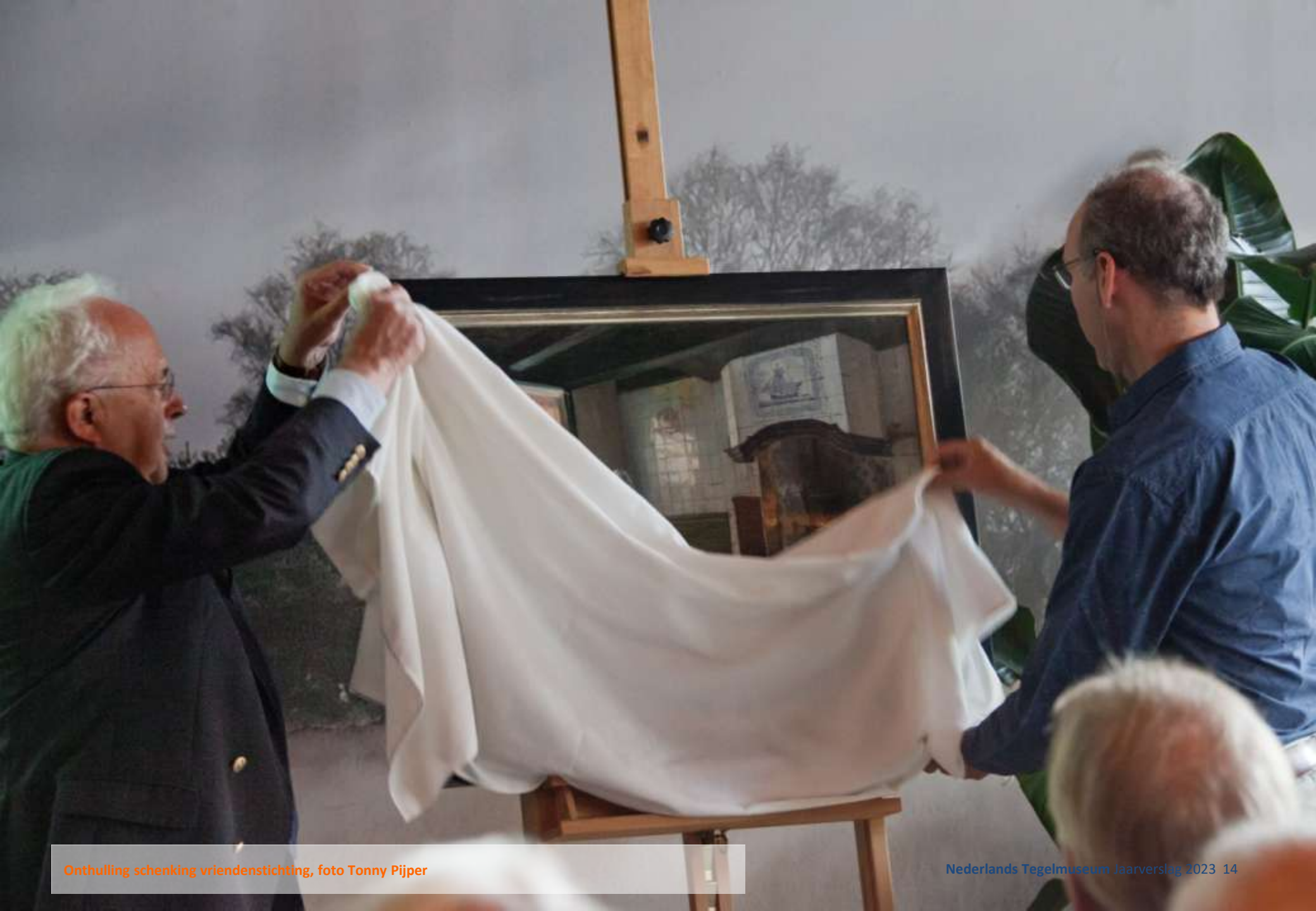
Onthulling schenking vriendenstichting